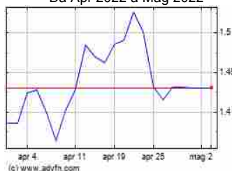
Grafico Azioni Emak (BIT:EM) Storico Da Apr 2022 a Mag 2022