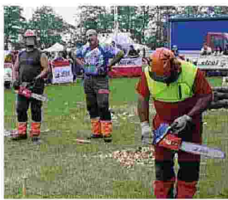
Tutti pronti per una sfida