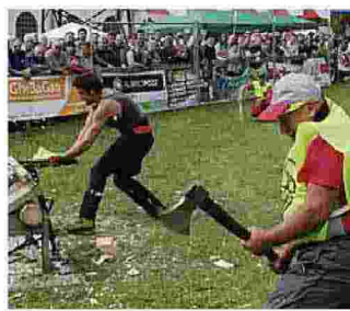
A colpi di accetta si taglia un tronco