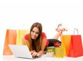
Cresce la popolarità degli acquisti "self service"