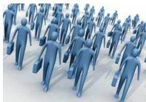
Il punto sull'ICT nel Mezzogiorno