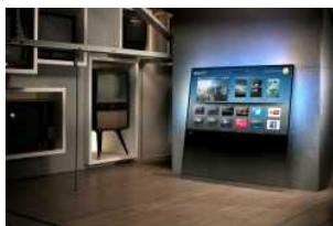
Il Philips DesignLine premiato con iF Gold Award