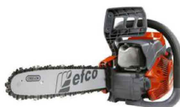
EfcO MT 4110