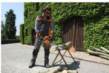
Oleo-Mac GS 451

Tra le novità in vetrina a EIMA, le nuove motoseghe Oleo-Mac GS 371, GS 411, GS 451 ed EfcO MT 3710, MT 4110, MT 4510 sono state sviluppate per un'ampia gamma di utenti e di distinguono per compattezza, la versatilità e il buon rapporto peso-potenza, assicurando ottime prestazioni di taglio in qualsiasi tipo di impiego. Il motore due tempi , premiato al Concorso Novità Tecniche 2018 , è dotato di sistema di ricircolo dei gas di scarico che riduce l'accesso di miscela fresca allo scarico: questa soluzione permette di ridurre gli incombusti senza doversi affidare interamente a sistemi di after treatment.