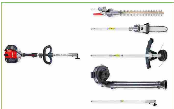
Nuovo Emak Efco DS 3000 D, decespugliatore multifunzionale e versatile

permette di ottenere alte prestazioni e regolarità di funzionamento. In più la bobina digitale , con regolazione elettronica e limitatore di giri, assicura un avviamento agevolato contenendo il consumo di carburante.