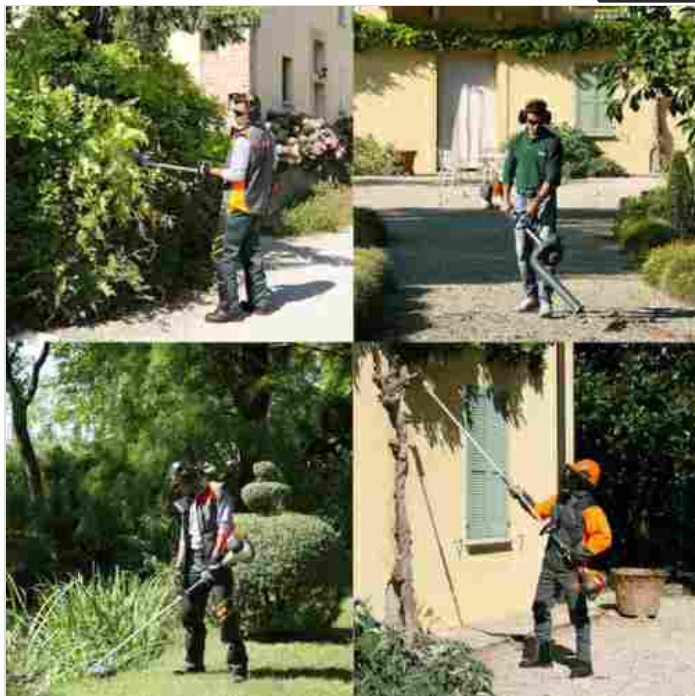
Oleo-Mac BC 300 D si trasforma in quattro applicazioni diverse