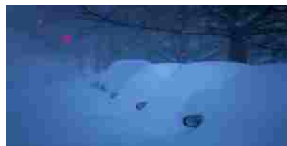
IMMAGINE DEL GIORNO

Obama: il discorso sullo Stato dell' Unione