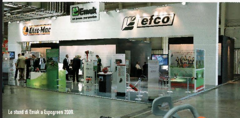
Lo stand di Emak a Expogreen 2009.