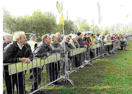
Parte del numeroso pubblico che ha seguito la manifestazione