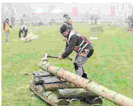
Tutto pronto per il taglio di un albero a colpi di accetta