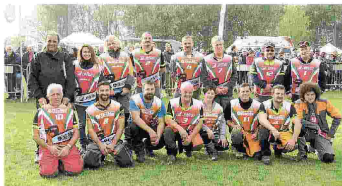
I finalisti del pomeriggio al Campionato Italiano di Triathlon del Boscaiolo