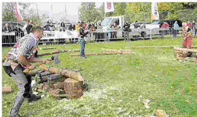
Il taglio con l'accetta dei tronchi, una delle prove affrontate