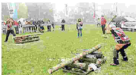
Concorrenti in gara durante le massacranti prove