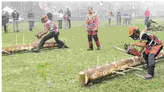
Un giudice osserva due concorrenti in azione sul campo di gara di Riccò