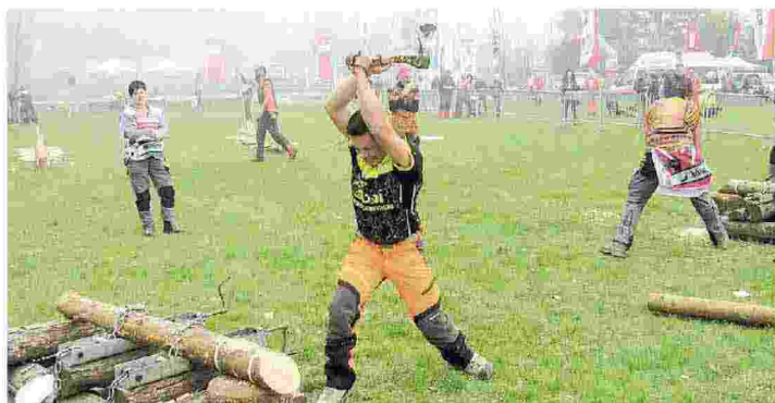
La spettacolare sfida tra i migliori tagliatori di legna italiani che si è tenuta ieri a Riccò di Serramazzoni