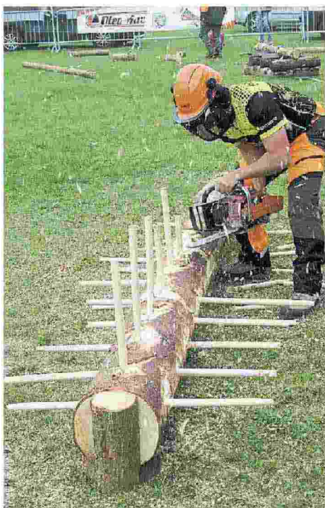
La pulizia di un tronco