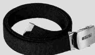
Abbigliamento Oleo-Mac - cintura

Emak è uno dei player di riferimento nell'offerta di soluzioni innovative per il giardinaggio, l'agricoltura, l'attività forestale e l'industria. La ditta produce e distribuisce macchine, componenti e accessori ad alto valore tecnologico, progettati per agevolare e rendere più efficiente l'attività dei nostri clienti. Il modello produttivo è flessibile, focalizzato sulle fasi ad alto valore aggiunto dell'engineering, dell'industrializzazione e dell'as-