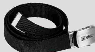
Abbigliamento Efco - cintura

semblaggio. Gli impianti sono orientati alla "lean manufacturing", con il coinvolgimento della catena di fornitura sulla base del modello della fabbrica estesa.