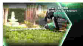
Hitachi Serie Cordless 36V con batterie al litio