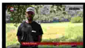
Decespugliatore High Torque SDK