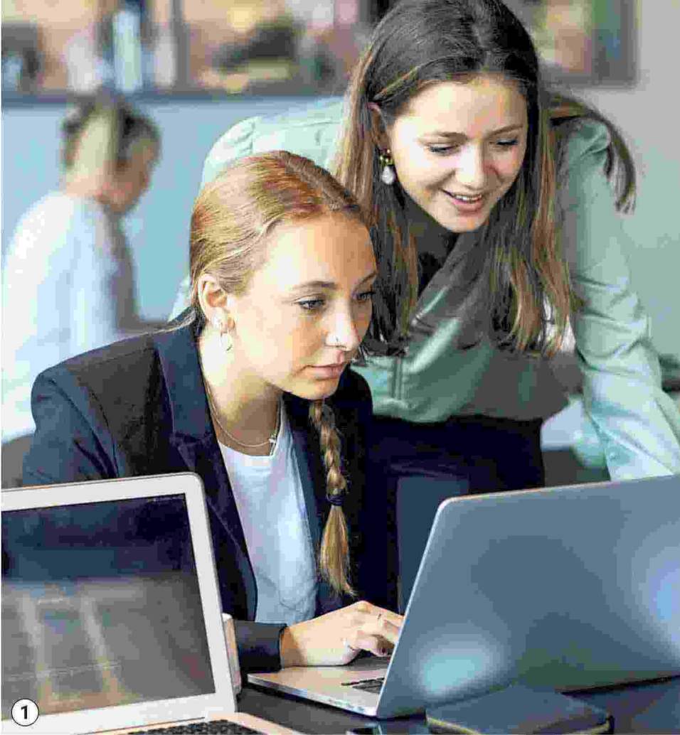
① Donne e datore di lavoro ideale, nello studio Itqf pesano qualità e numero dei giudizi

Ritaglio stampa ad uso esclusivo del destinatario, non riproducibile.